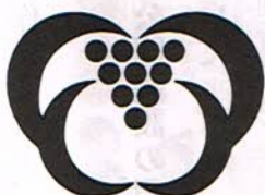
御所野連合町内会

今回は御所野学院の生徒さんたちと先生も手伝って下さいました。若い人たちの労力は本当に助かりました。大変ありがとうございました